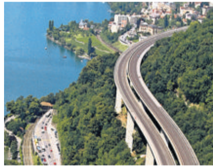
Le viaduc de l'A9, à Chillon P. MARTIN