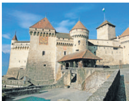
Le château de Chillon. P. MARTIN-A