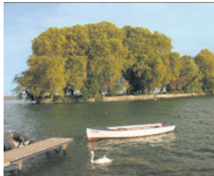
L'île de La Harpe, à Rolle. GILLES SIMOND