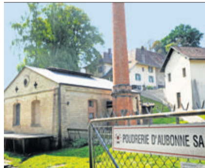
La Poudrerie d'Aubonne. A. ROUËCHE