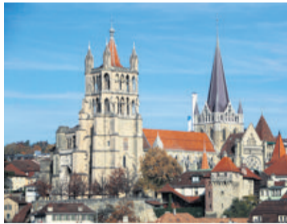
La cathédrale de Lausanne. P. MARTIN