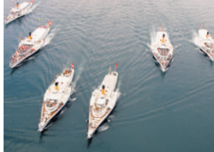
Les bateaux de la CGN. YVAIN GENEVAY