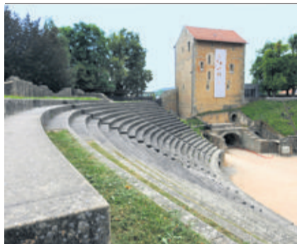
Les vestiges d'Avenches. J. JOUSSON-A