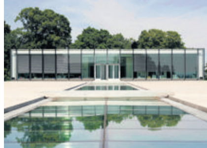
Le siège de l'UEFA, à Nyon. M. ROD