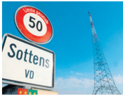
L'émetteur de Sottens. J.-P. GUINNARD