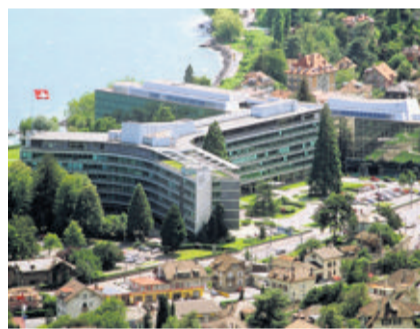
Le siège de Nestlé, à Vevey. CURCHOD