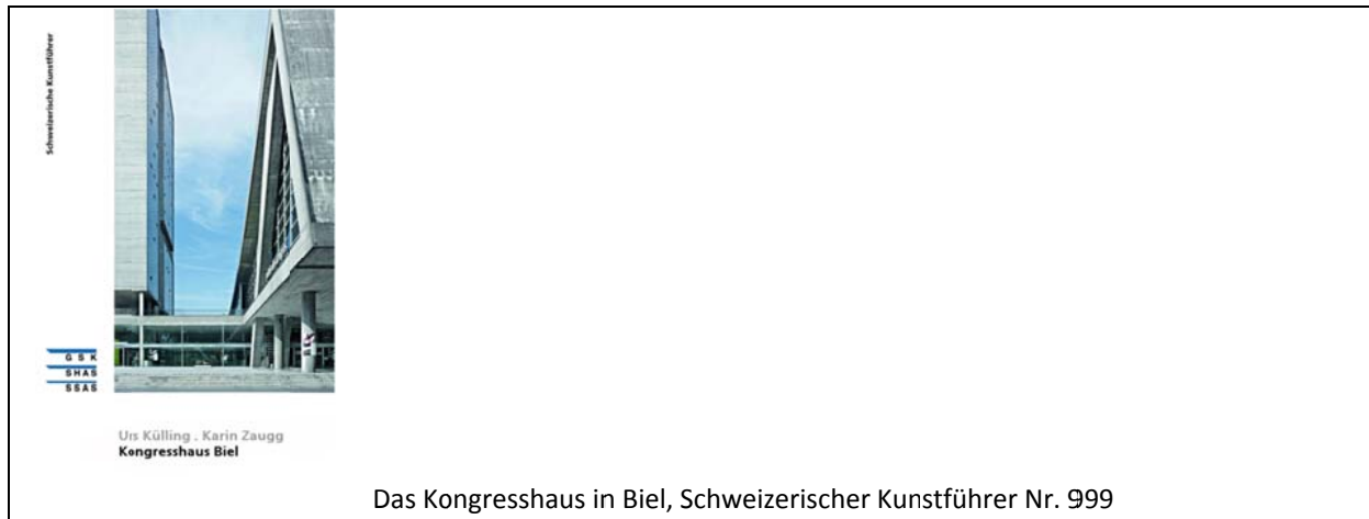
Das Kongresshaus in Biel, Schweizerischer Kunstführer Nr. 999

Die Schweizerischen Kunstführer weisen im Durchschnitt einen Umfang von 44 Seiten auf. Die ersten zehn sogenannten «Kleinen Führer» zählten nur acht Seiten. Im Jahr 1958 erschienen sowohl 8-, als auch 12- und 16-seitige Führer. Heute umfassen die dünnsten Führer minimal 24 Seiten, die dicksten 88 Seiten. Besonders umfangreiche Kunstführer werden als Doppelnummern herausgegeben.