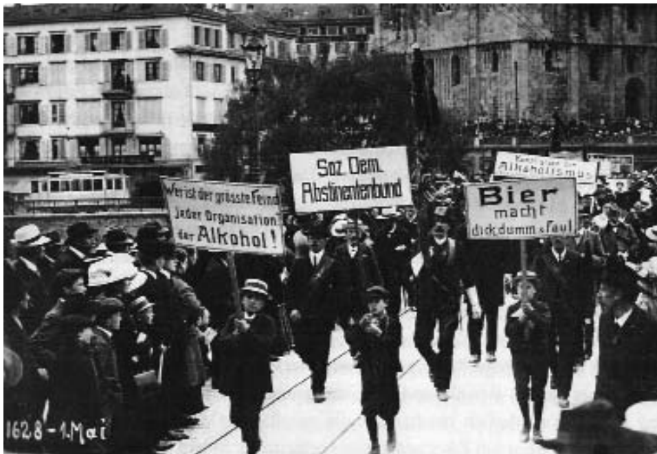
5 La ligue social-démocrate pour l'abstinence a une place fixe dans le cortège du 1 er mai. Ici en 1912 sur le Münsterbrücke à Zurich.